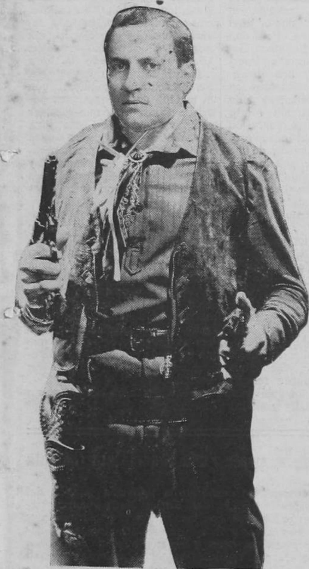
Fotografía histórica tomada el 14 de Febrero de 1932 en uno de los fortines del Bellavista, mientras el distinguido nombre de ciencia, Dr. Calderón Guardia, «curaba» a los josefinos.